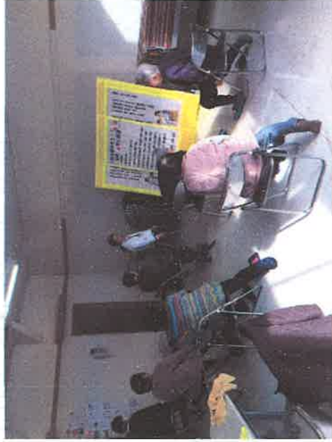
飯南町保健福祉課 地域包括支援センター