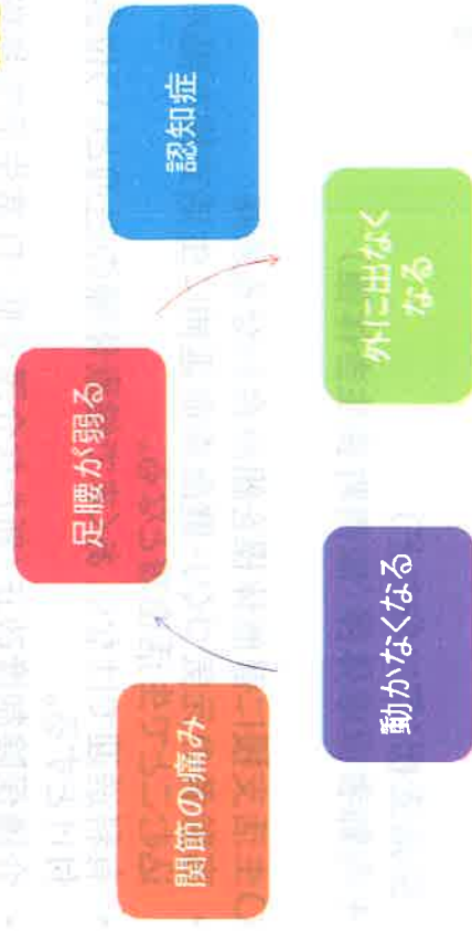
飯南町保健福祉課 地域包括支援センター