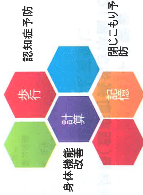
飯南町保健福祉課 地域包括支援センター